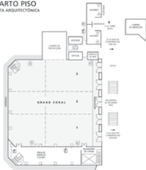
CUARTO PISO PLANTA ARQUITECTÓNICA