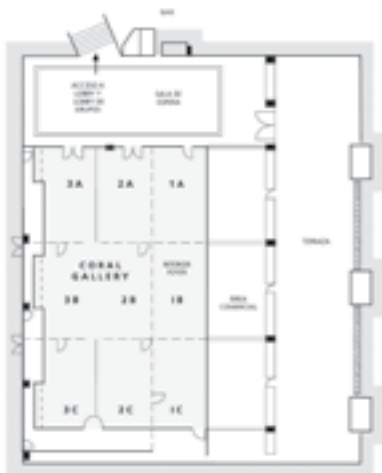
PLANTA BAJA PLANTA ARQUITECTÓNICA