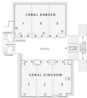
CORAL KINGDOM Y CORAL GARDEN PLANTA ARQUITECTÓNICA